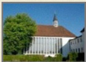
„bei sich sein“